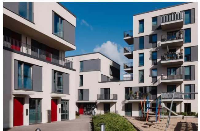
Projekt der Charlottenburger Baugenossenschaft eG am Groß-Berliner Damm 152 in Adlershof.

Dass sich dieses langfristige Denken auch in der Mietengestaltung widerspiegelt, zeigen die aktuellen Zahlen: Die durchschnittliche Bestandsmiete lag Mitte 2025 bei Genossenschaften bei 6,29 Euro nettokalt pro Quadratmeter und damit 18,4 Prozent unter dem Berliner Mietspiegel (7,71 €/m 2 ). Bei Neuvermietungen verlangten Berliner Wohnungsgenossenschaften Mitte 2025 im Durchschnitt 7,95 Euro nettokalt pro Quadratmeter. Damit lagen die durchschnittlichen Angebotsmieten in Wohnungsportalen für Berlin (18,76 €/m 2 ) 136 Prozent über den Neuvertragsmieten von Genossenschaften. Für eine 60-Quadratmeter-Wohnung entspricht das gegenüber einer durchschnittlichen Angebotsmiete einer Ersparnis von gut 7.800 Euro pro Jahr.