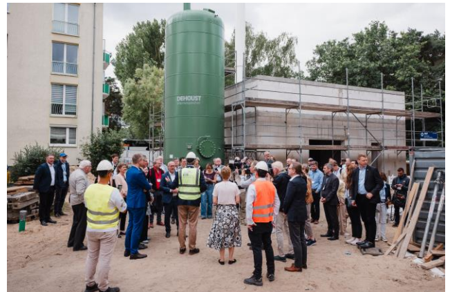
Projekt Wohnungsgenossenschaft Köpenick Nord eG an der Lahmertstraße 9 in Grünau mit Speicher zur Wärmerückgewinnung aus Abwasser.

Genossenschaften brauchen besseren Zugang zu bezahlbarem Bauland. Dazu gehört insbesondere, landeseigene Grundstücke verstärkt zum Kauf, statt ausschließlich im Erbbaurecht anzubieten sowie neue Modelle wie den Mietkauf zu entwickeln. Nicht nur Neubau, sondern auch der Erwerb bestehender Wohnungsbestände kann den genossenschaftlichen Anteil am Berliner Wohnungsmarkt erhöhen. Dafür braucht es geeignete Förderinstrumente und ausreichende Modernisierungsmittel.