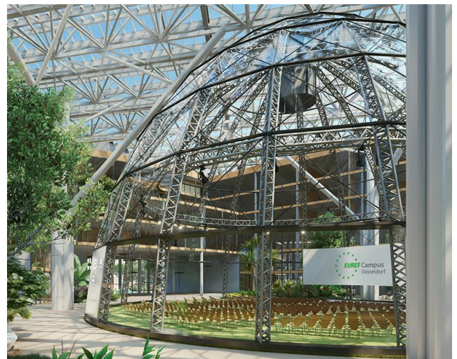
Düsseldorf EUREF AG

Die Wirtschaftsförderung Düsseldorf hatte die EUREF AG im Frühjahr 2019 für den Standort Düsseldorf gewinnen können. In Düsseldorf entsteht der zweite Innovationscampus dieser Art in Deutschland. Vorbild ist der EUREF-Campus in Berlin, der seit 2008 eine Plattform und ein Netzwerk für Zukunftstechnologien bietet.