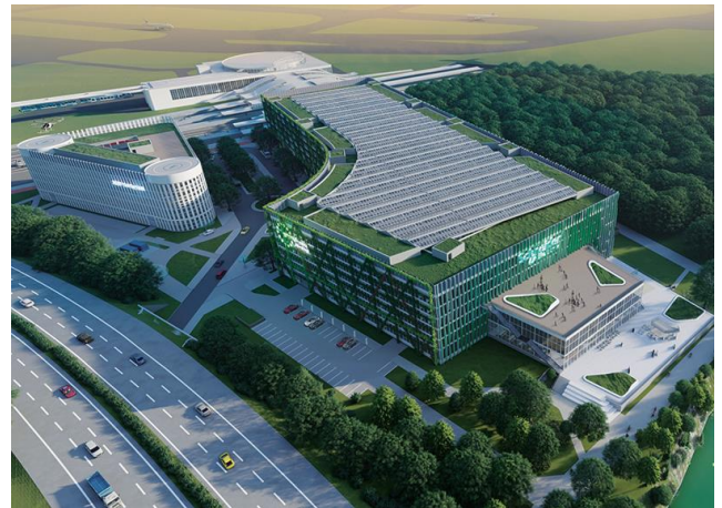
Düsseldorf EUREF AG

Kooperation und Innovation. Den schaffen wir auf dem EUREF-Campus Düsseldorf. Vielen Dank an Politik und Verwaltung für die Unterstützung!“