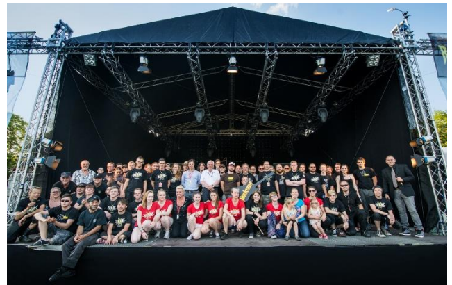
„Ein starkes Team!": Die Rocktreff- und Spielfest-Crew. www.rocktreff.de

ROCKTREFF: Freitag, 18., Samstag, 19., und Sonntag, 20. Juni 2021. Das Spielfest: Samstag 19., und Sonntag, 20. Juni 2021.