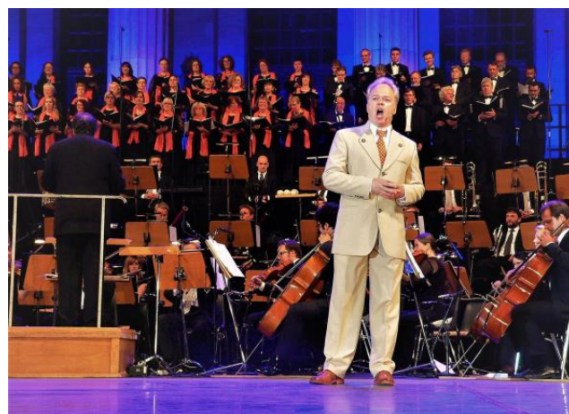
Heiko Reissig singt beim Classic Open Air 2015 auf dem Berliner Gendarmenmarkt.

Gerade sang er in diesem Sommer als umjubelter Stargast bei der großen Jubiläumsgala der 20. Elblandfestspiele Wittenberge, die auch wieder vom RBB-Fernsehen ausgestrahlt wurde. Für diese erfolgreichen Festspiele im Land Brandenburg hatte er 1998 die Idee und gründete sie als bisher jüngster Festspielintendant Deutschlands.