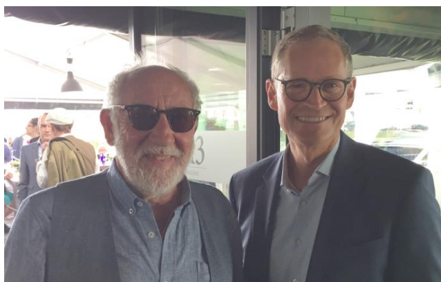
Dieter Hallervorden mit dem Gastgeber Michael Müller , SPD-Chef und Regierender Bürgermeister.

Somit kann die stärkste Kraft auch das größte Sommerfest feiern. Wieder am wunderschönen Tempelhofer Hafen am Pier 13. Die Gästeliste war lang, keiner wollte fehlen.